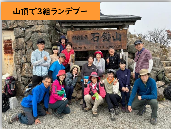
山頂で3組ランデブー

変更プランも満喫。楽しさ100%の山行でした。どんな状況でも安全に楽しめる方法を見出す山岳会のリーダーとメンバーに感謝です。（記：関口）