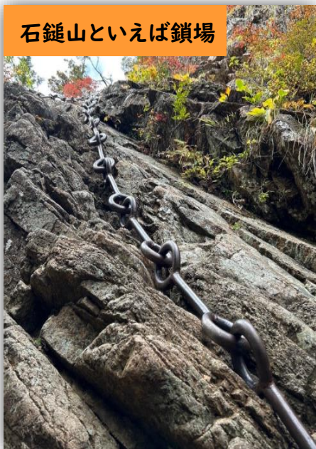
石鎚山といえば鎖場