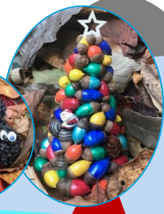
高御位山で拾ったドングリ (里山の芸術家 作)