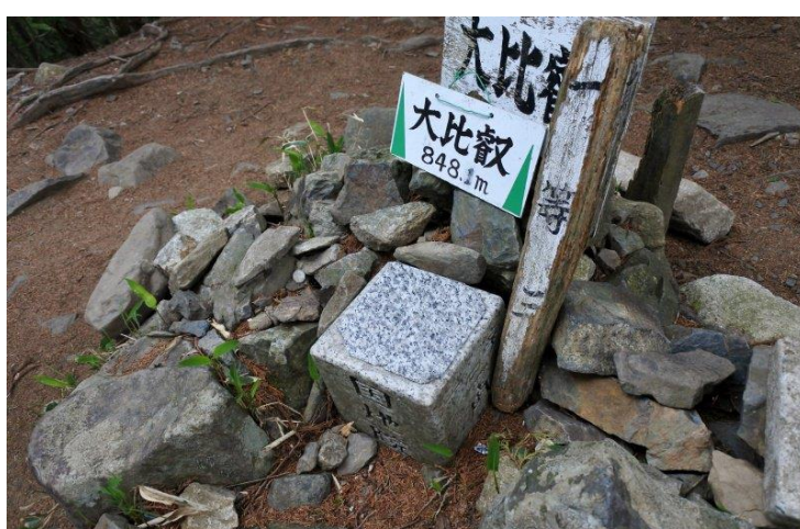
大比叡に設置された一等三角点、点名は比叡山